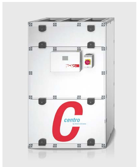
aerosilent centro-900 von gasser ENERGY